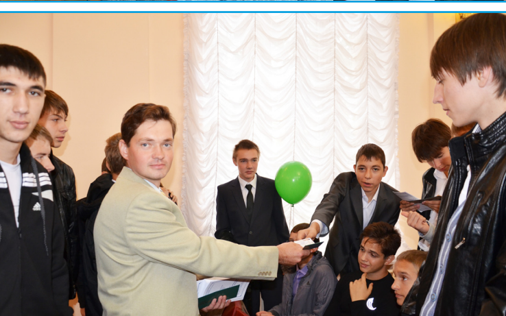
Первокурсников встречали кураторы групп