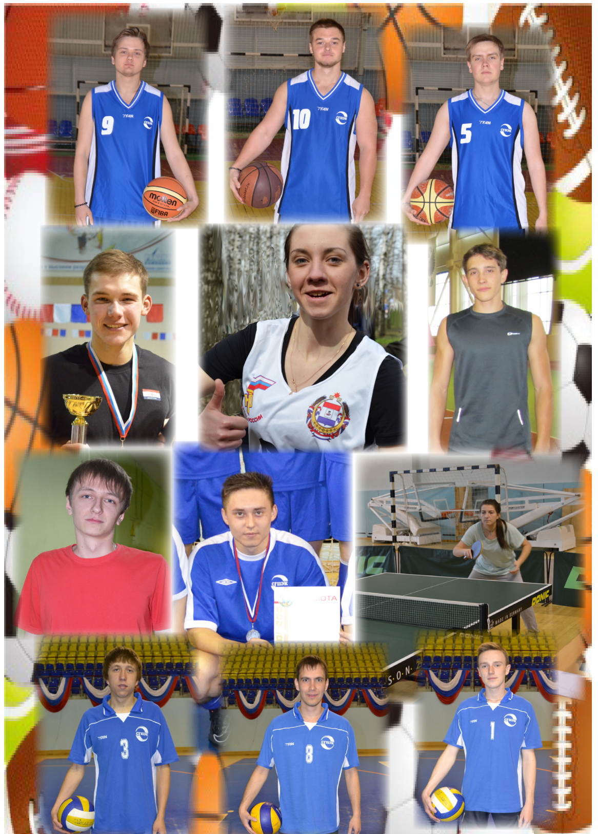
Страницку подготовила руководитель физического воспитания Т. А. Кругликова

Быть, а не казаться - девиз, который должен носить в своем сердце каждый гражданин, любящий свою родину. Служить правде - как в научном, так и в нравственном смысле этого слова. Быть человеком. Н. Пирогов